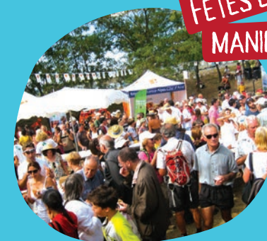
FÊTES ET MANIFESTATIONS