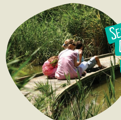
SENTIERS DECOUVERTE à terre et en mer